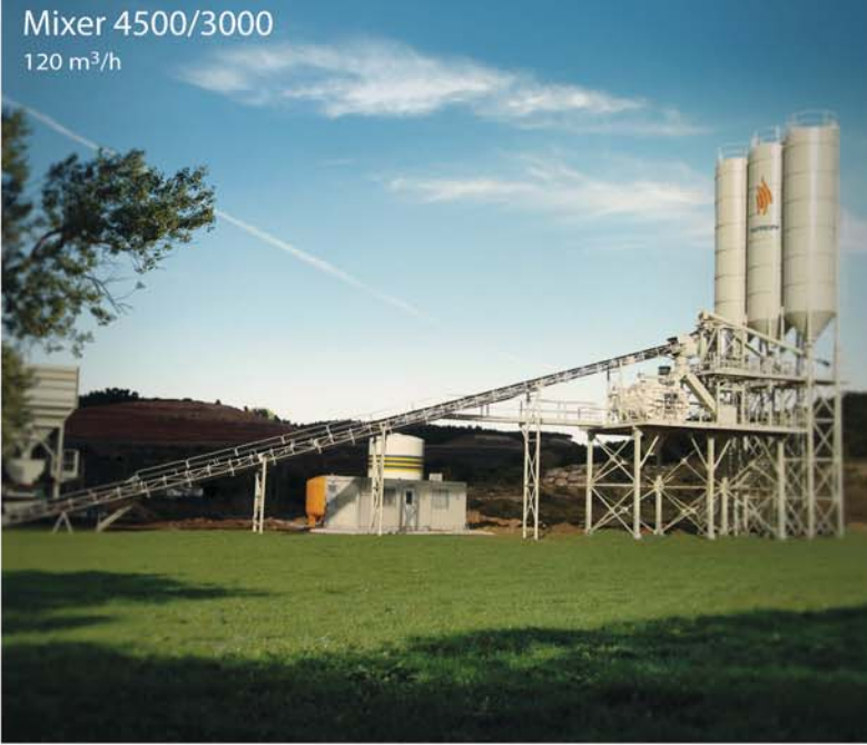
Mixer 4500/3000 120 m 3 /h