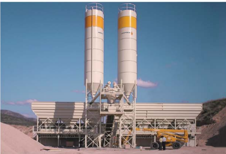
Mixer 1500/1000 40 m 3 /h