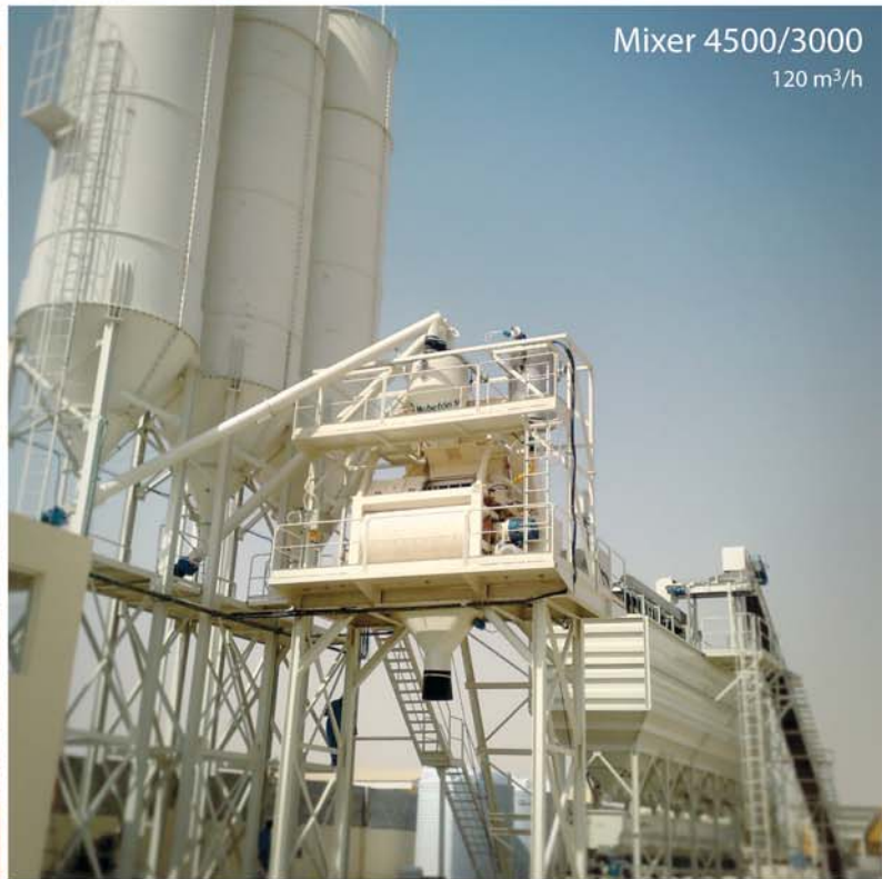
Mixer 4500/3000 120 m 3 /h