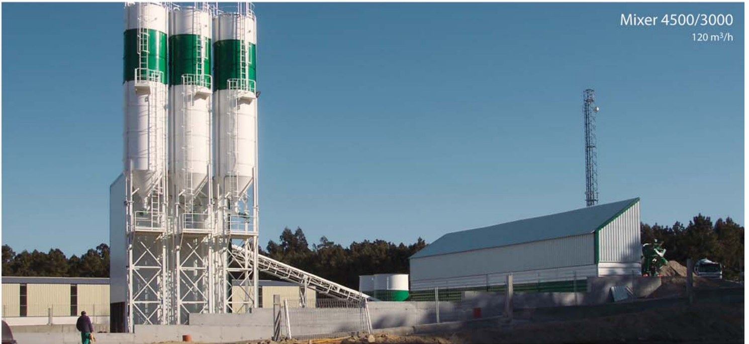
Mixer 4500/3000 120 m 3 /h